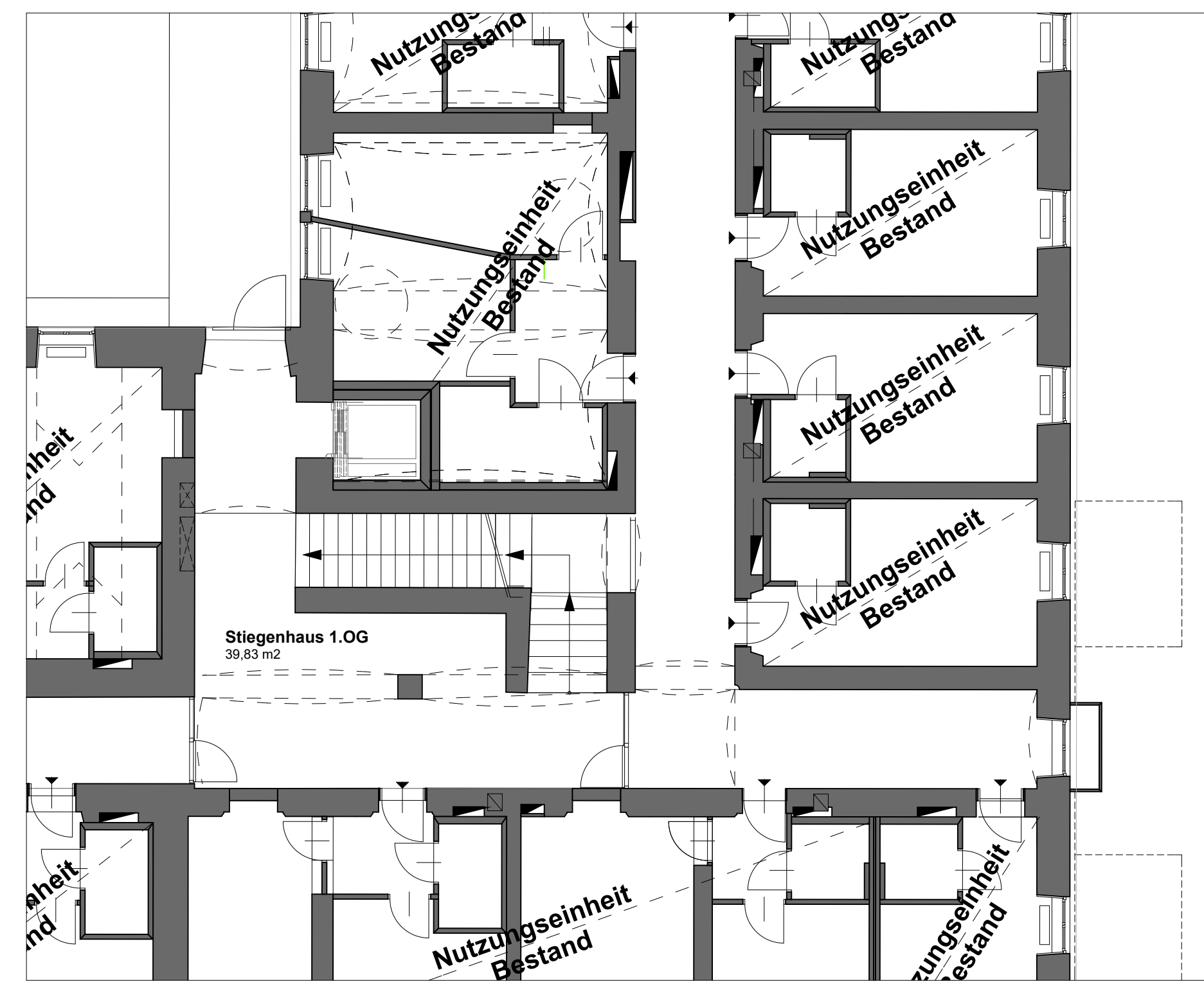
GRUNDRISS 1.OBERGESCHOSS 1:100