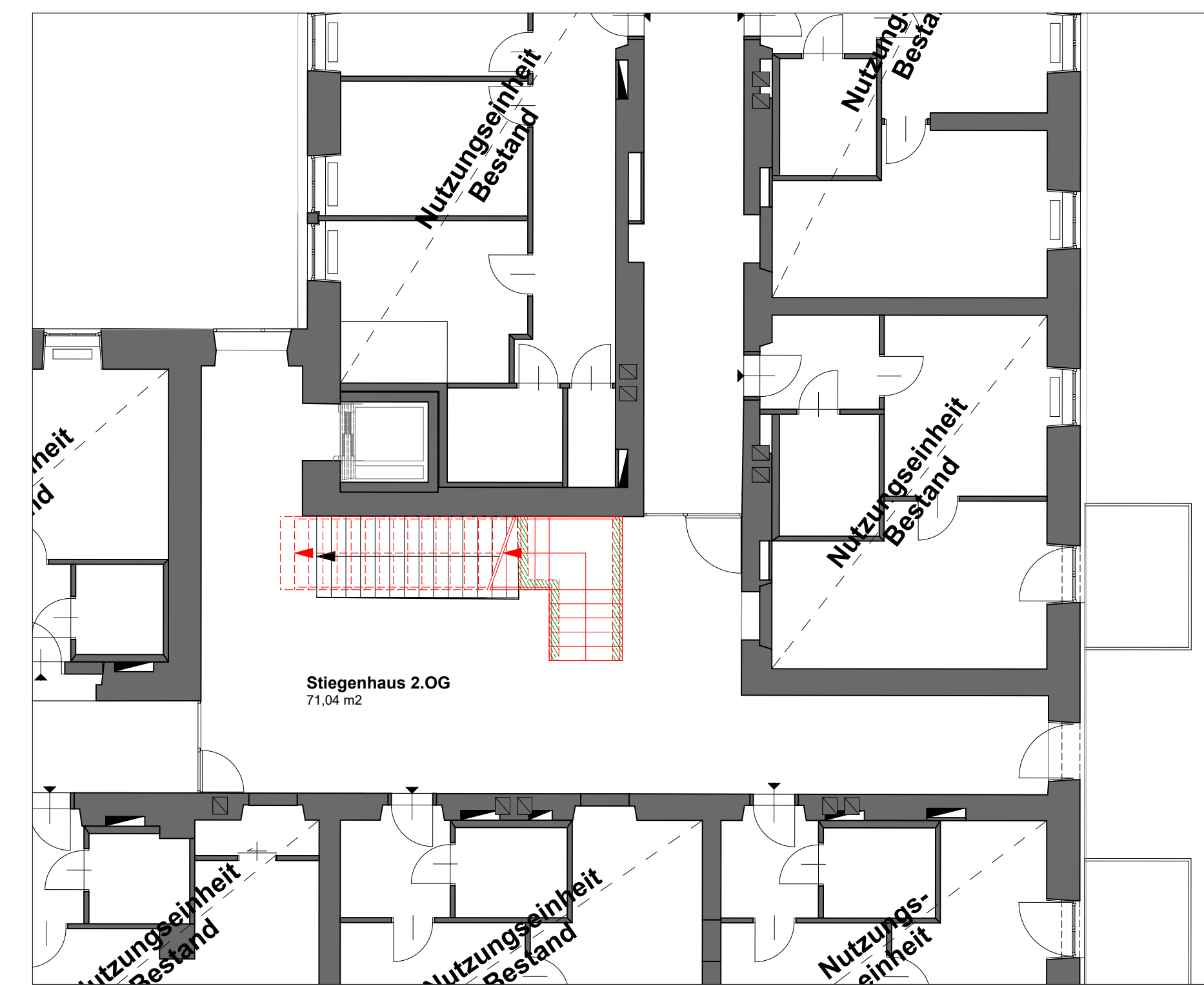
GRUNDRISS 2.OBERGESCHOSS 1:100